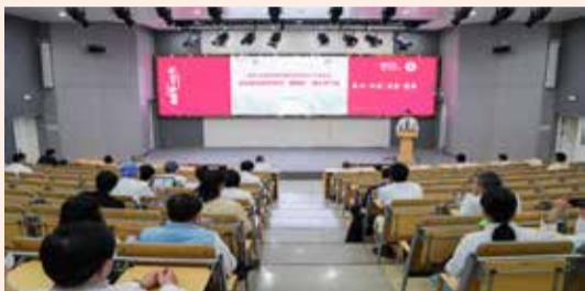
国家心血管疾病临床医学研究中心召开PI工作会议

会议由国家心血管病中心主任、中国医学科学院阜外医院院长、临床医学研究中心主任胡盛寿院士主持，部分医院领导班子成员、职能部门负责人、临床医学研究中心主要负责同志、全体PI和科研人员代表等70余人参加会议。