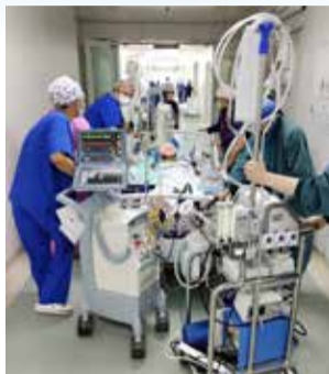
由于设备较多，为确保转运过程中所有器械正常工作，来自多个学科的十几位医护人员一起转运患者

面对如此复杂危急的情况，内科的治疗已经举步维艰，患者的器械辅助无法撤机，心功能也没有恢复的迹象。心外