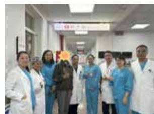
患者出院前与医护人员合影