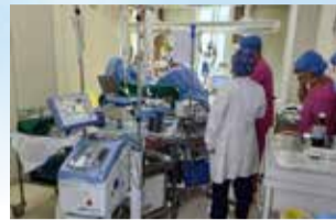
血管外科与心外科专家床旁缝合