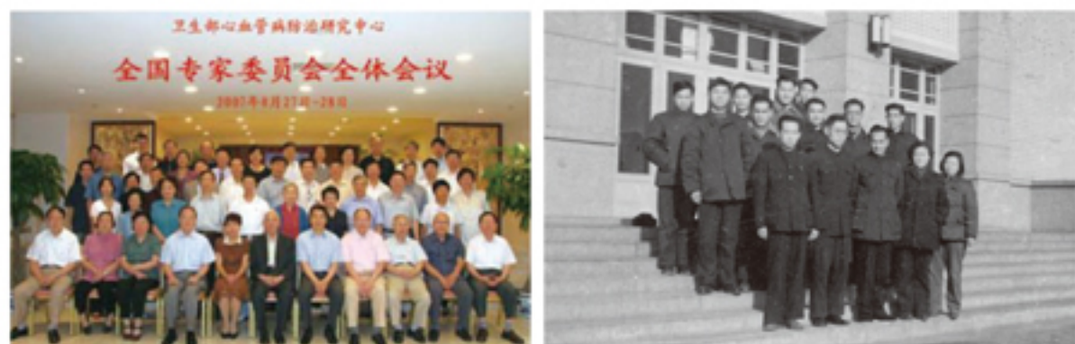
2007年NCCD全国专家委员会