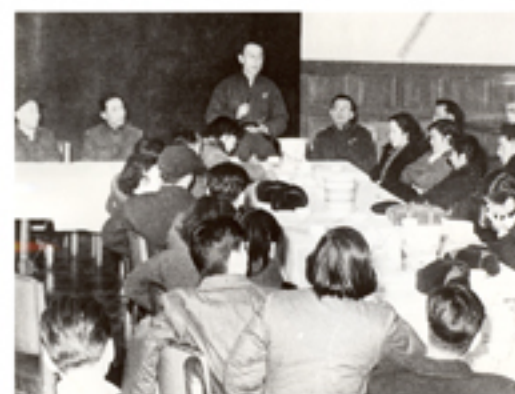
黄宛教授为做好心电图的普及工作，1965年，组织召开冠心病协作研究会。