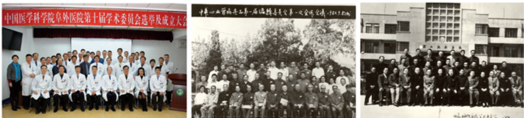
秉承协和医者严谨、求精的学术精神，成立多学科学术委员会。