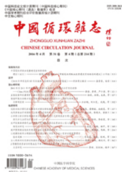
中国循环杂志创刊至今30年。