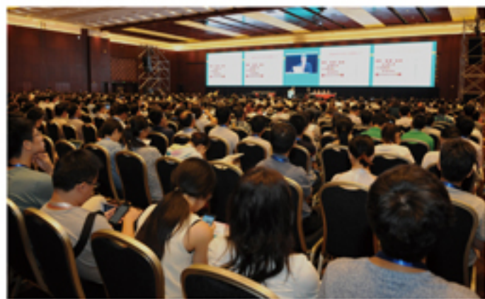
中国心脏大会（CHC）成功举办12届，已经发展成为我国乃至亚太地区心血管业界最具影响力的心血管疾病学术盛会。